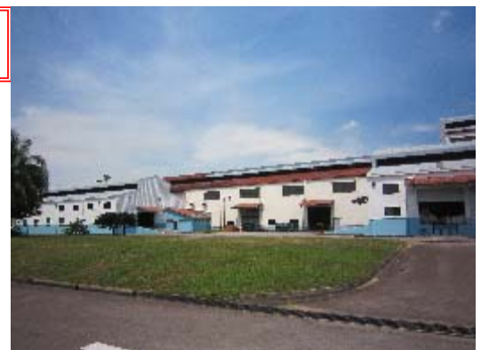
DOWA ECO-SYSTEM SINGAPORE 工場外観